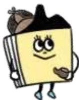
福山市図書館キャラクター としょ子