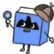
福山市中央図書館キャラクター ぶっくん