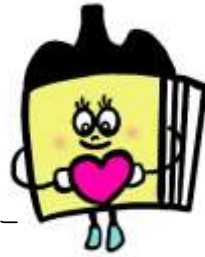
福山市図書館キャラクター 【としょ子】