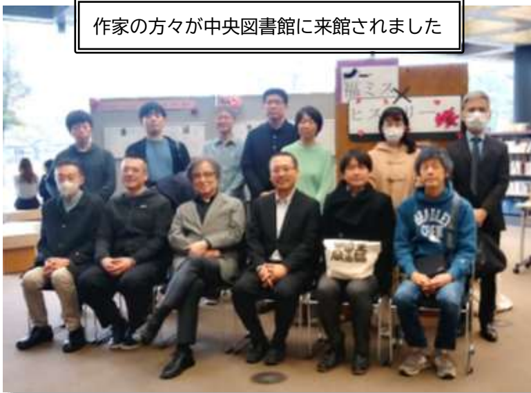
作家の方々が中央図書館に来館されました