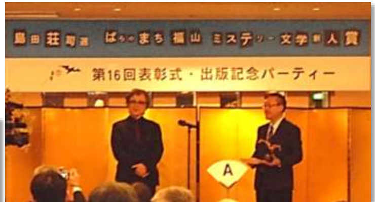
↑ 出版記念パーティーの様子