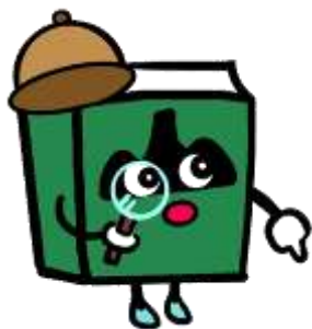
福山市中央図書館キャラクター

ぶっくんからのクイズに答えて図書館博士になろう。 答えは「よんでよんで」のどこかにあるよ。